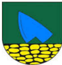
Bačka - Bacska